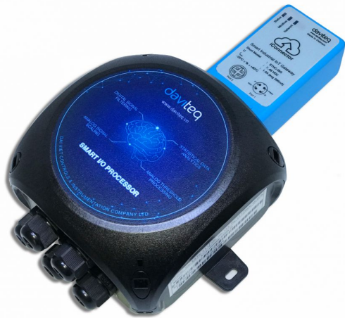
iCONNECTOR TÍCH HỢP I/O MODULE